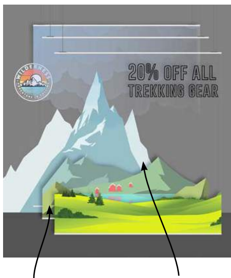
Displays multiples pour créer des effets 3D